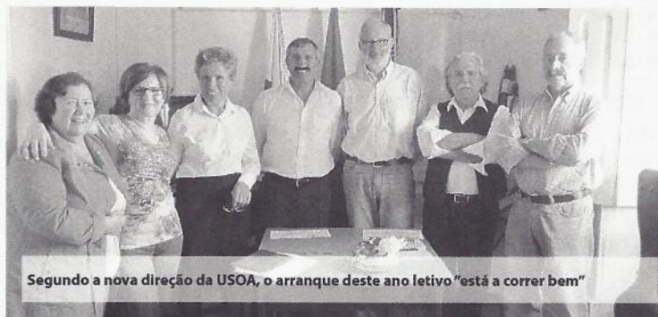
Segundo a nova direção da USOA, o arranque deste ano letivo "está a correr bem"

Das filiadas da RUTIS (Associação Rede de Universidades da Terceira Idade), a Universidade Sénior de Oliveira de Azeméis é a maior do distrito em termos de número de alunos, que, neste momento, ronda os 350.